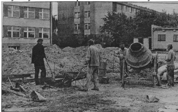
W Zespole Szkół Zawodowych przy ul. Polnej 13 w Poddębicach trwają prace przy budowie sali gimnastycznej. Na razie powstały jedynie wykop pod ławy fundamentowe. Przed nastaniem mrozów fundamenty zostaną zalane betonem. Prace posuwają się dość wolno, gdyż sala budowana jest ze środków społecznych. W czynnie społecznym wykonywanych jest też wiele prac. Przy budowie hali pracują również, w ramach robót publicznych, poddębicki bezrobotni.